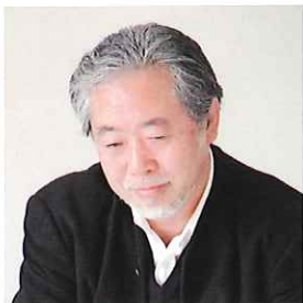
HIROSHI NAITO ▶ 内藤 廣